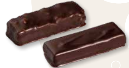
Les Pralinés chocolat noir Amande et croustillant / Pécan