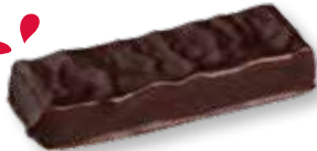
Poivre de Gorille Légèrement épicé